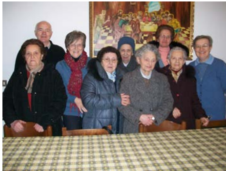
La présidente de la Compagnie de Vicenza 17.12.2012