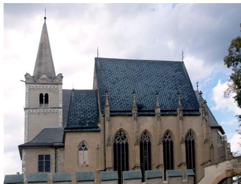
La cattedrale in Spisska Kapitula,