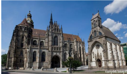
Kosice - Duomo di Sant'Elisabetta

Via Campagna, 16 22020 Gaggino Faloppio CO